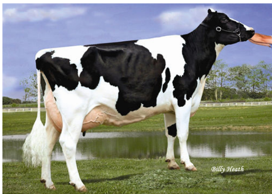
LADYS-MANOR RUBY D SHAWN FIFTH DAM